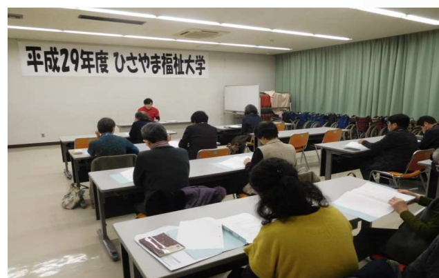
ひさやま福祉大学